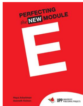
Perfecting the NEW Module E