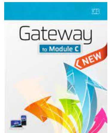
Gateway to Module C