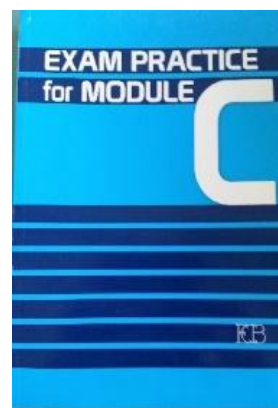
Exam Practice for Module C