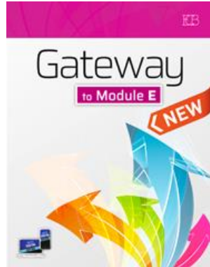
Gateway to Module E