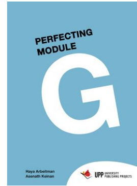
Perfecting Module G לא משומש