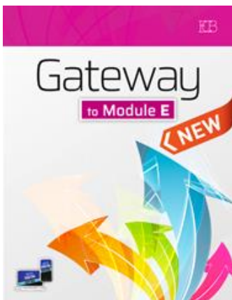
Gateway to Modules E לא משומש